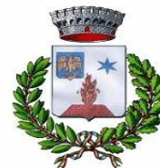
COMUNE DI BERZO INFERIORE